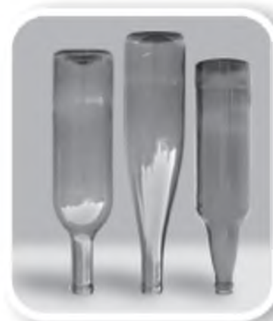
Esvazie e guarde garrafas sem uso de cabeça para baixo