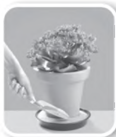
Coloque areia no pratinho dos vasos de plantas