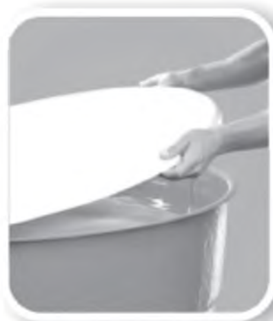
Tampe caixas d'água