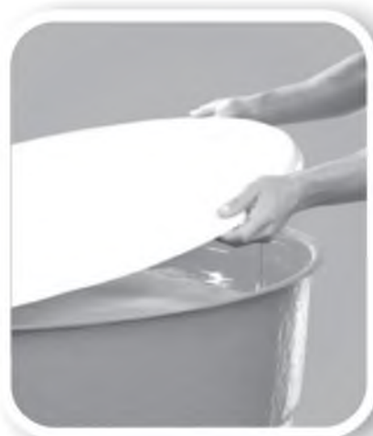
Tampe caixas d'água