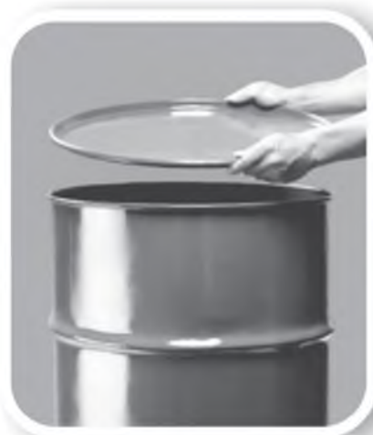
Feche bem tonéis e barris

Defenda sua família, seus vizinhos, sua comunidade. Não basta combater o mosquito. Precisamos eliminar seus criadouros e qualquer local ou recipiente que acumule água parada.