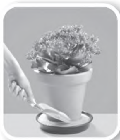
Coloque areia no pratinho dos vasos de plantas