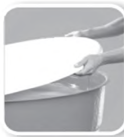
Tampe caixas d'água