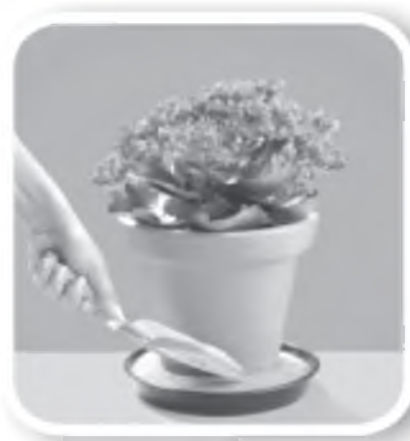
Coloque areia no pratinho dos vasos de plantas