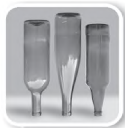
Esvazie e guarde garrafas sem uso de cabeça para baixo