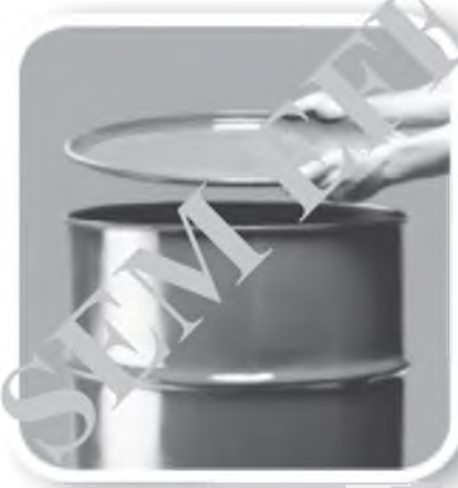
Fechem bem tonéis e barris

Defenda sua família, seus vizinhos, sua comunidade. Não basta combater o mosquito. Precisamos eliminar seus criadouros em qualquer local ou recipiente que acumule água parada.