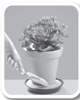
Coloque areia no pratinho dos vasos de plantas