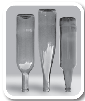
Esvazie e guarde garrafas sem uso de cabeça para baixo