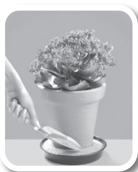
Coloque areia no pratinho dos vasos de plantas