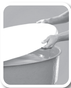
Tampe caixas d'água