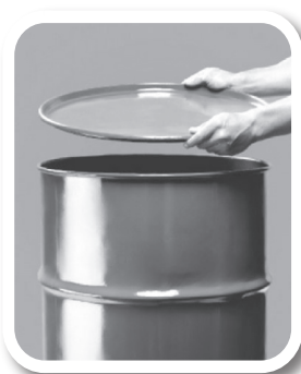
Feche bem tonéis e barris

Defenda sua família, seus vizinhos, sua comunidade. Não basta combater o mosquito. Precisamos eliminar seus criadouros e qualquer local ou recipiente que acumule água parada.