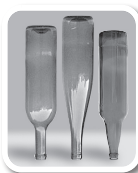
Esvazie e guarde garrafas sem uso de cabeça para baixo