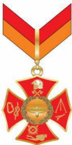
Medalha do Mérito Fênix (anverso)