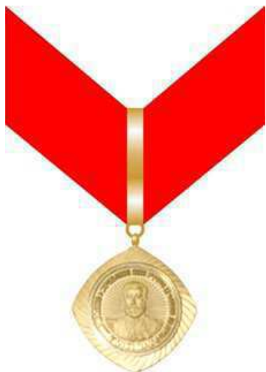
Medalha Ordem do Mérito Dom Pedro II Gradação Comendador (anverso)