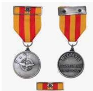
Medalha do Mérito por Reconhecimento Profissional Gradação Prata