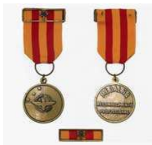
Medalha do Mérito por Reconhecimento Profissional Gradação Ouro