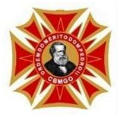
Medalha Ordem do Mérito Dom Pedro II Gradação Grã-Cruz (anverso)