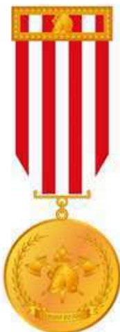
Medalha do Mérito Soldado do Fogo (anverso)