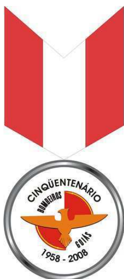
Medalha do Cinquentenário do CBMGO (anverso)