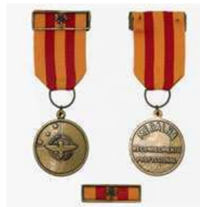
Medalha do Mérito por Reconhecimento Profissional Gradação Bronze