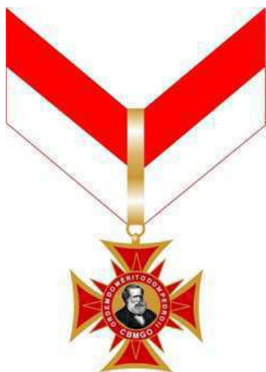
Medalha Ordem do Mérito Dom Pedro II Gradação Grande-Oficial (anverso)