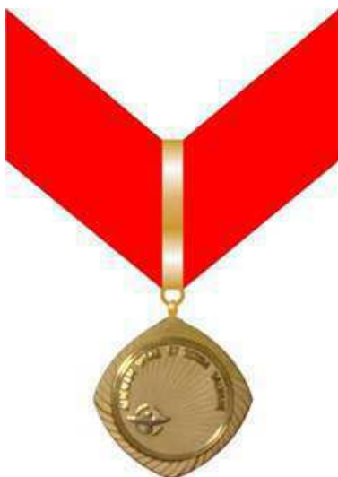
Medalha Ordem do Mérito Dom Pedro II Gradação Comendador (verso)