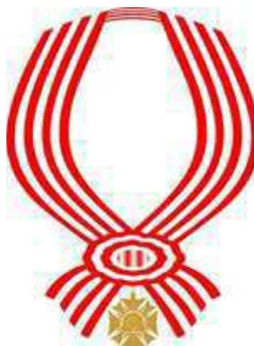
Medalha Ordem do Mérito Dom Pedro II Gradação Grã-Cruz (verso)