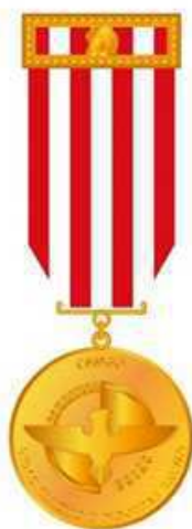
Medalha do Mérito Soldado do Fogo (verso)