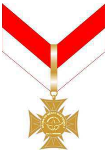
Medalha Ordem do Mérito Dom Pedro II Gradação Grande-Oficial (verso)