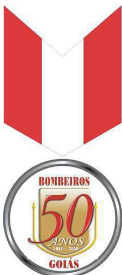
Medalha do Cinquentenário do CBMGO (verso)