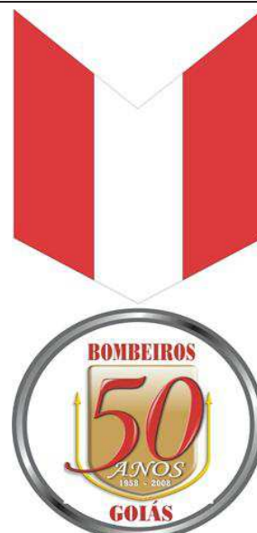
Verso da Medalha do Cinquentenário do CBMGO