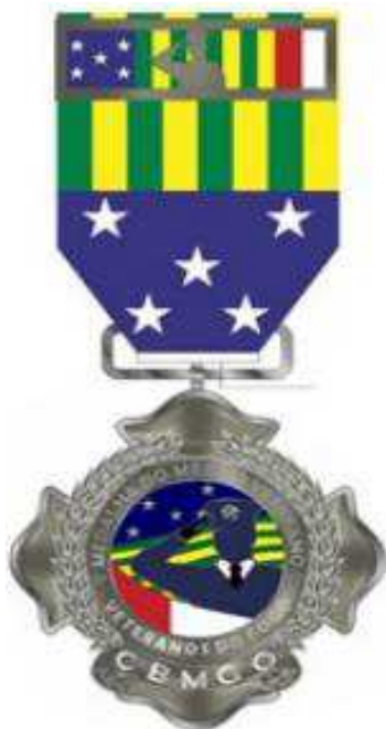
Anverso da Medalha do Mérito Veterano