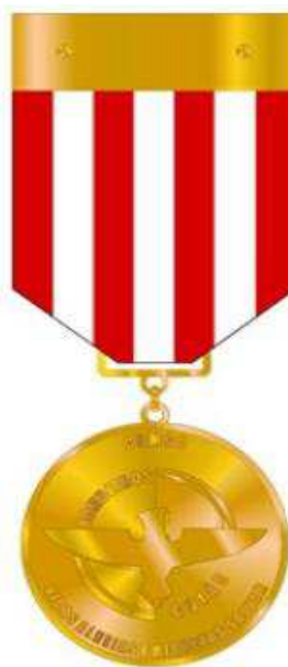
Verso da Medalha do Mérito Soldado do Fogo