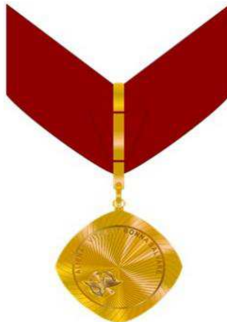
Verso da Medalha Comendador