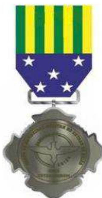
Verso da Medalha do Mérito Veterano