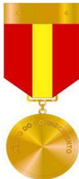
Verso da Medalha do Mérito do Conhecimento