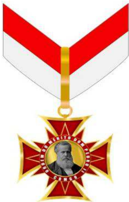
Anverso da Medalha Grande-Oficial