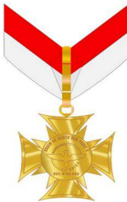
Verso da Medalha Grande-Oficial