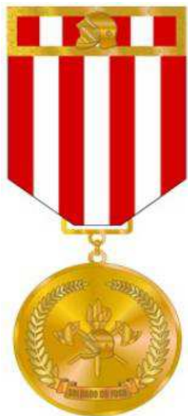
Anverso da Medalha do Mérito Soldado do Fogo