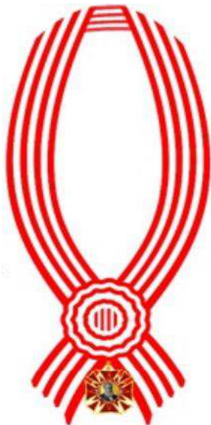
Anverso da fita