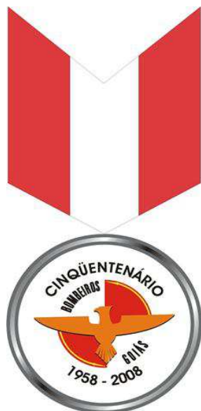
Anverso da Medalha do Cinquentenário do CBMGO