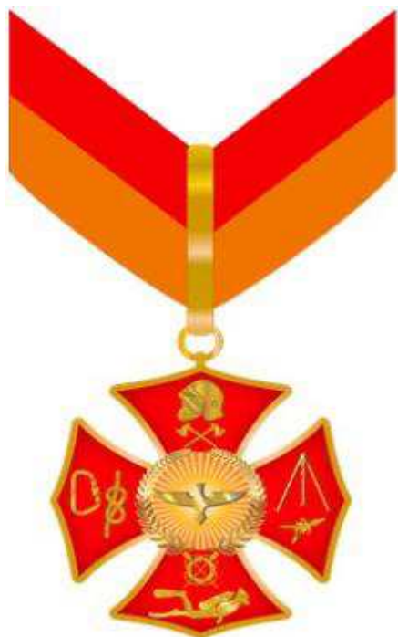
Anverso da Medalha do Mérito Fênix