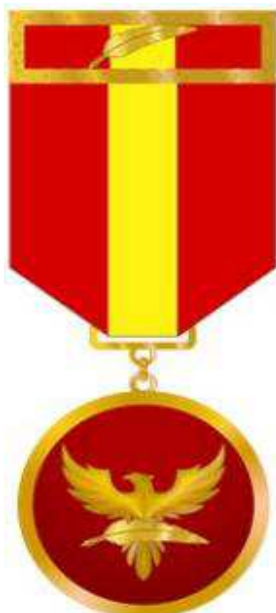
Anverso da Medalha do Mérito do Conhecimento