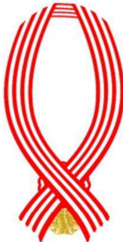
Verso da fita