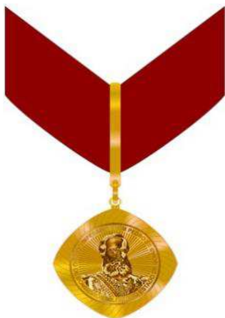
Anverso da Medalha Comendador