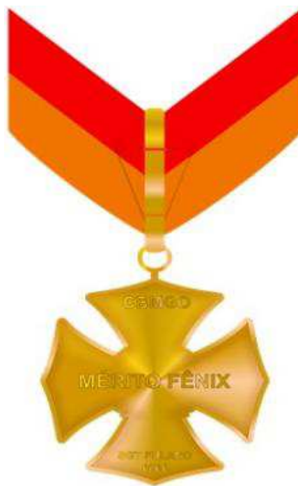
Verso da Medalha do Mérito Fênix