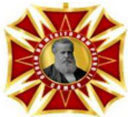
Anverso da Medalha Grã-Cruz